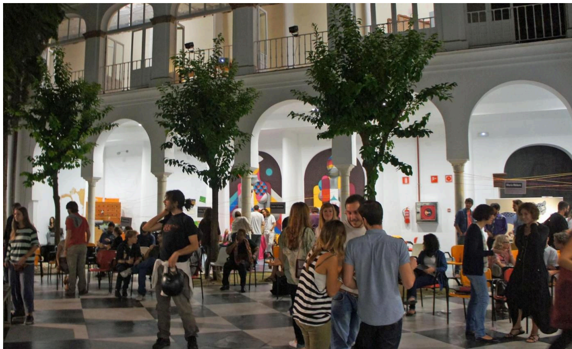
El Círculo volverá a acoger actividades del FeMÁS

El Festival de Música Antigua de Sevilla (FeMÁS), decano nacional y referente internacional en su género, que celebrará su 36 edición entre el 23 de marzo y el 13 de abril, apuesta un año más "por la divulgación de la música histórica reforzando sus contenidos académicos y formativos como piezas fundamentales de una programación que trasciende lo musical".