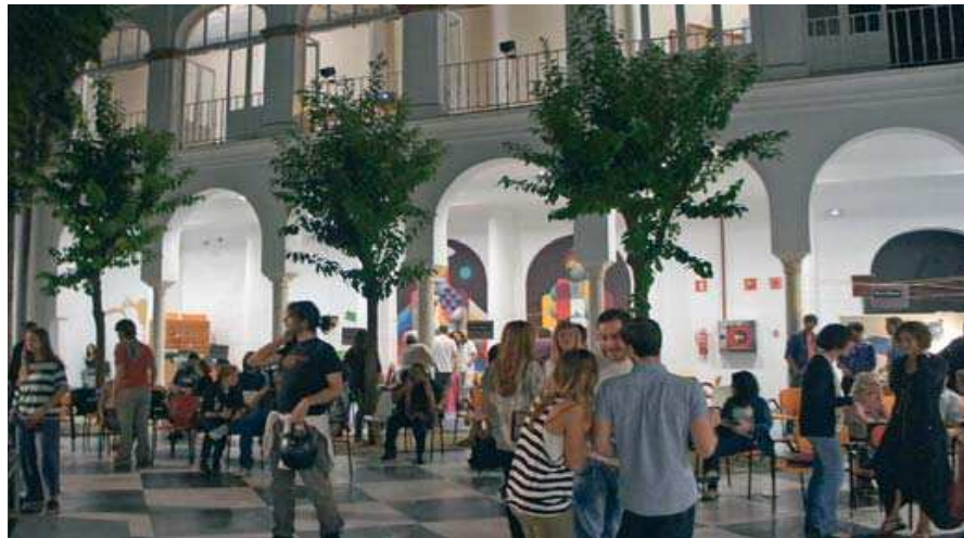
Un momento de las actividades del FeMÁS de la edición del pasado año de este festival.

Así, FeMÁS acoge, con la colaboración de la Universidad de Sevilla, una nueva edición del ciclo de conferencias “La escucha comprometida” para analizar aspectos de la diversidad musical en la Iberia medieval, así como te-