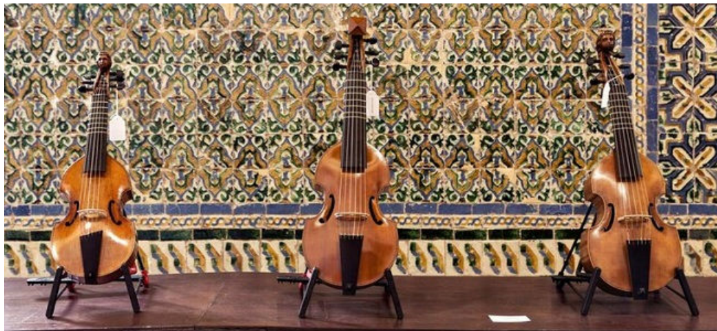
festivales Ciclo de conferencias La escucha comprometida en el FeMÀS