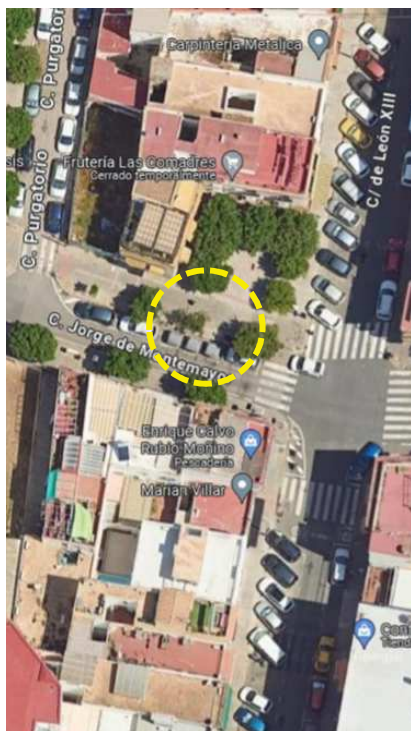
Localización: ID 43, Calle Jorge de Montemayor, distrito Macarena