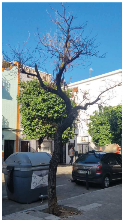
Vista general: árbol seco, en una encrucijada de calles comerciales de alta concurrencia