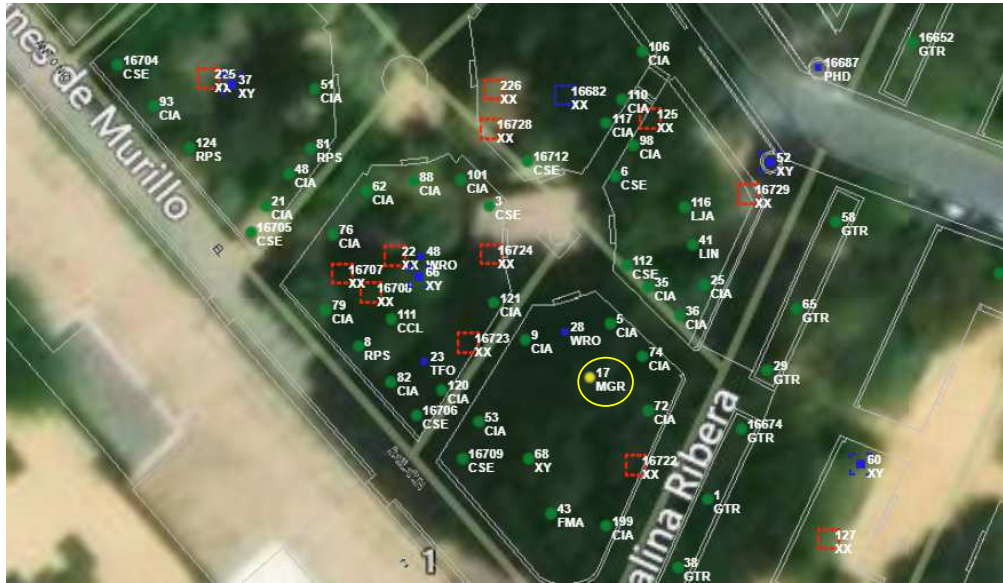
Localización del ejemplar de interés.

Ayuntamiento de Sevilla Plaza Nueva, 1 41001 Sevilla +34 955 010 010 www.sevilla.org