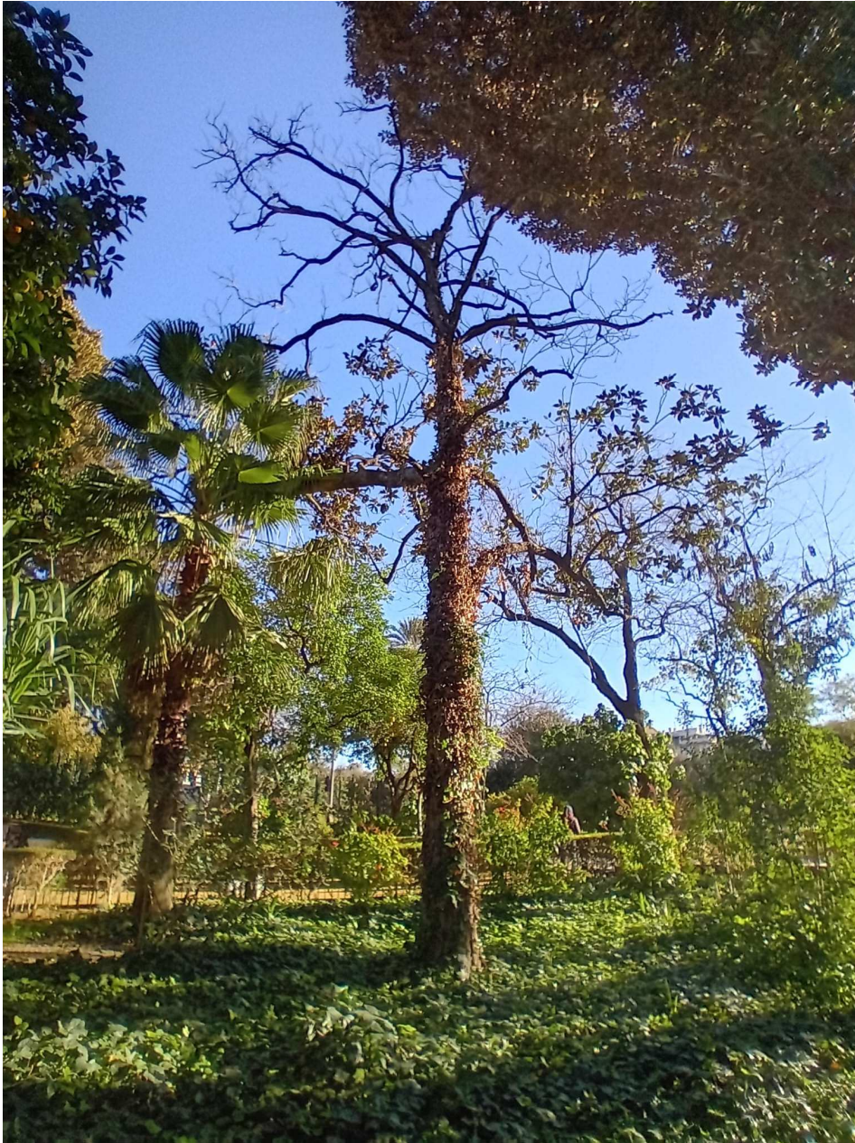
Vista general del ejemplar.

Ayuntamiento de Sevilla Plaza Nueva, 1 41001 Sevilla +34 955 010 010 www.sevilla.org