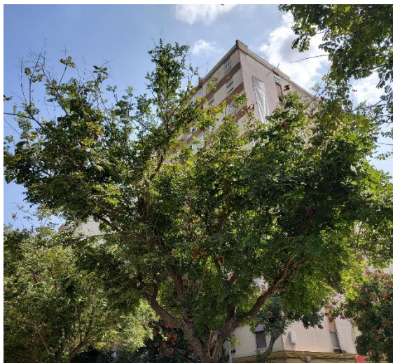
Imágenes del ejemplar con id 123417