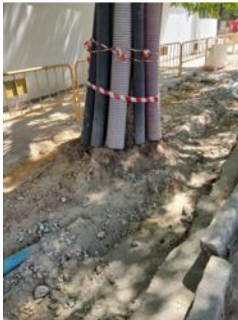
Obra de Gerencia de Urbanismo y MC_Julio 2024