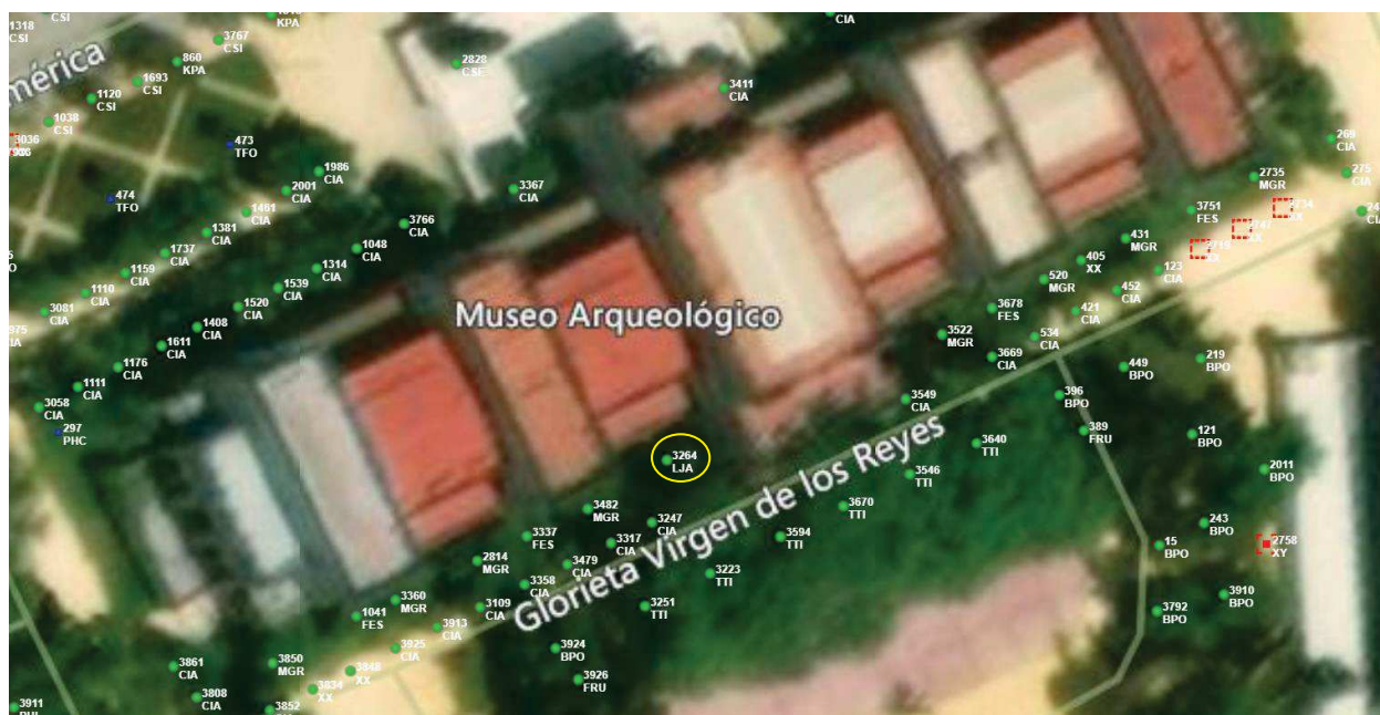
Localización del árbol marcado en amarillo.