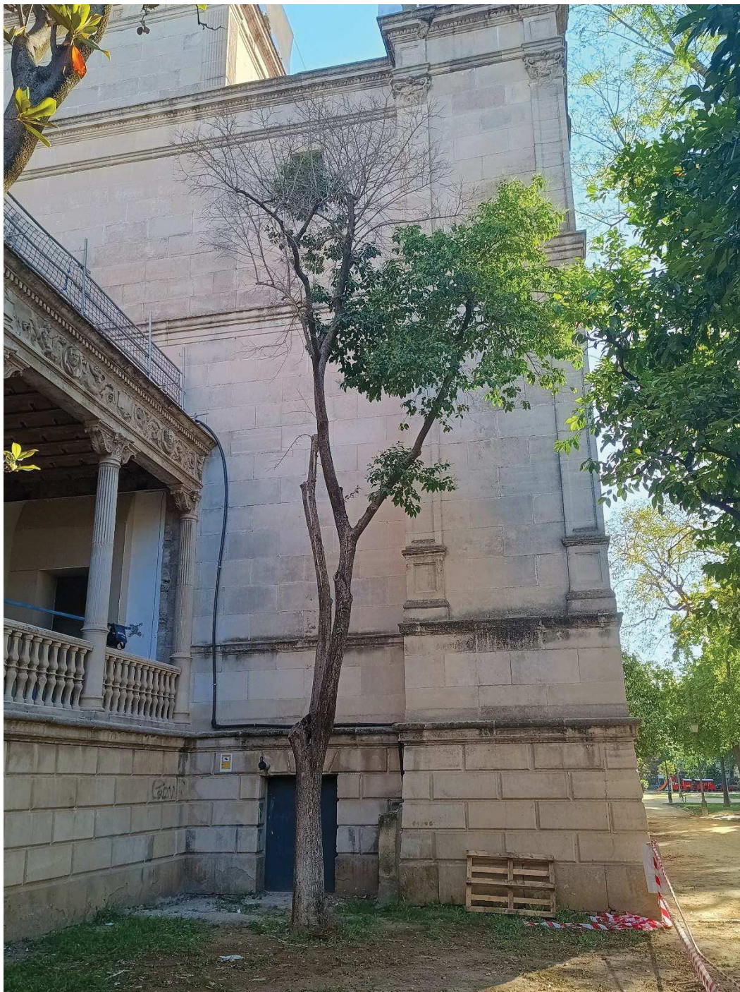
Vista general del ejemplar.