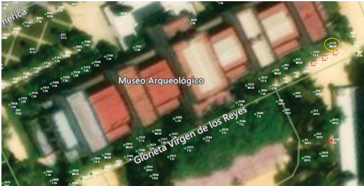
Localización del árbol marcado en amarillo.