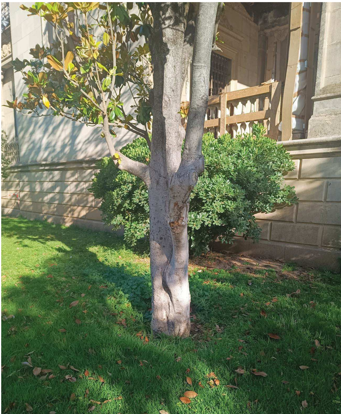
Detalle del cuello e inserción de eje del ejemplar.