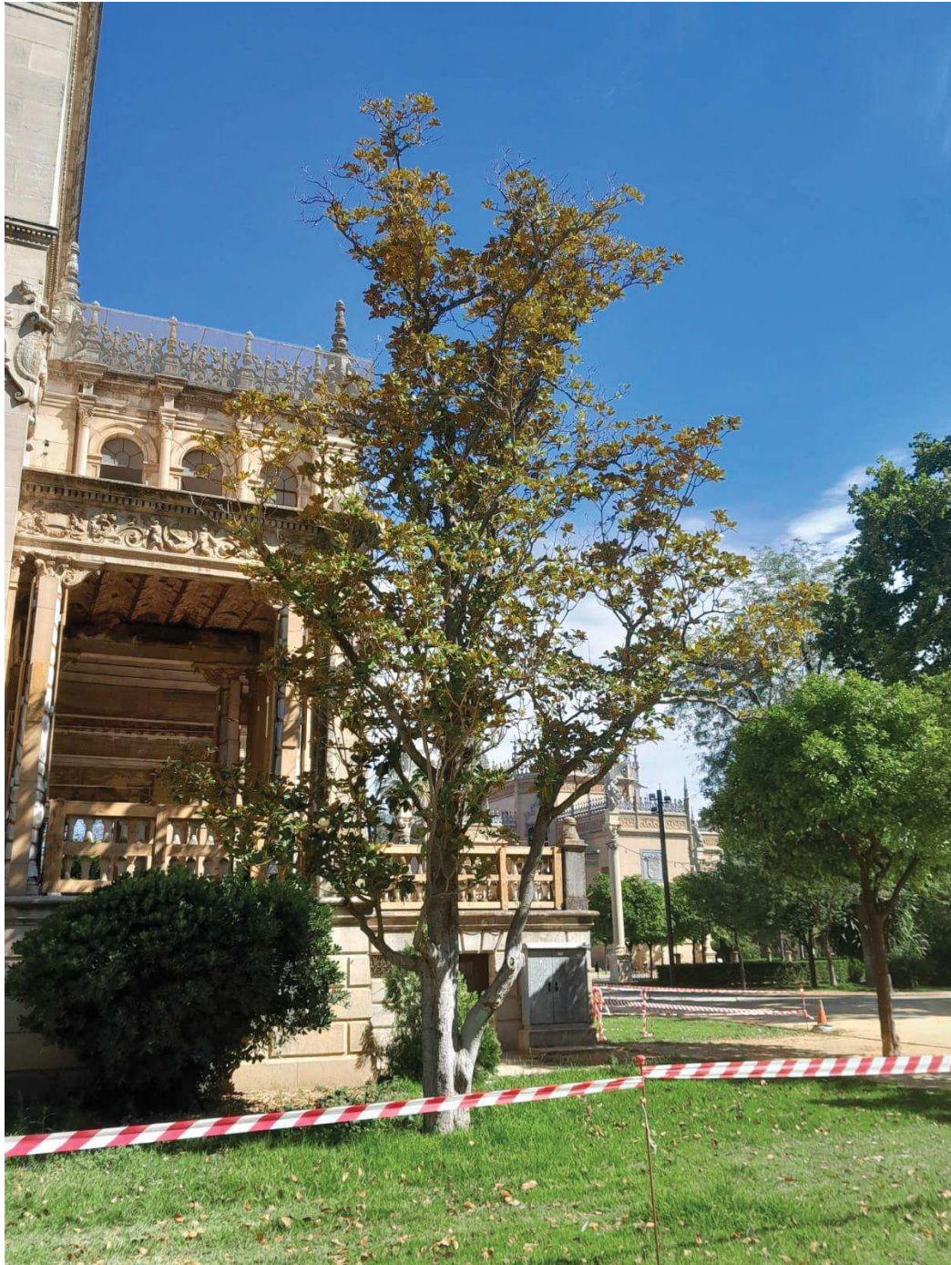
Vista general del árbol afectado