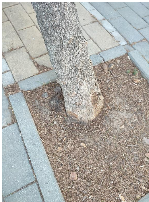
Imágenes del ejemplar con id 40481