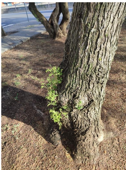
Imágenes del ejemplar con id 40476