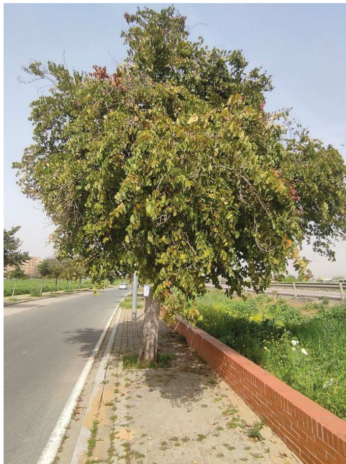
Vista general del ejemplar con ID 116980