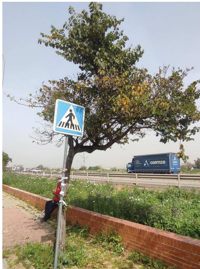
Vista general del ejemplar con ID 116983