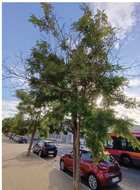
Vista general del ejemplar con id 43997. Ramas secas de calibre medio