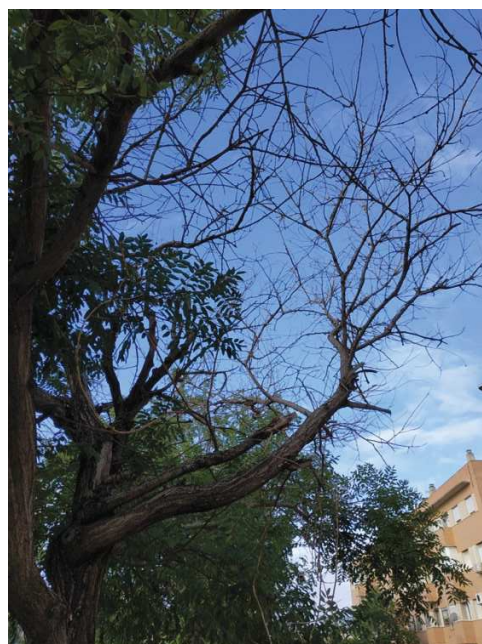
Vista general del ejemplar con id 44027. Copa parcialmente muerta.