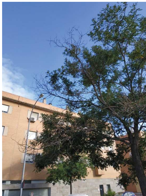
Vista general del ejemplar con id 44033, ramificaciones muertas