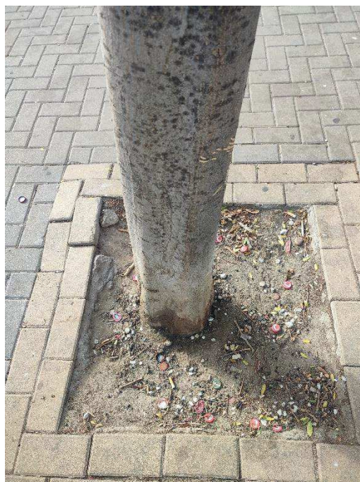
Imágenes del ejemplar con id 123183