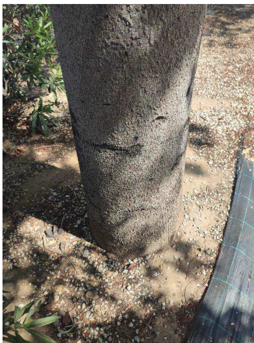
Imágenes del ejemplar con id 123189