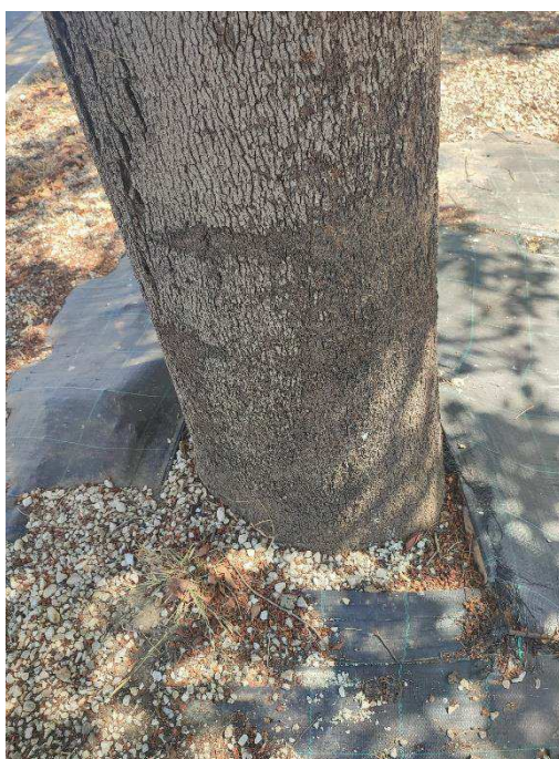
Imágenes del ejemplar con id 123193