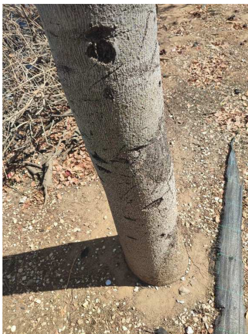
Imágenes del ejemplar con id 45