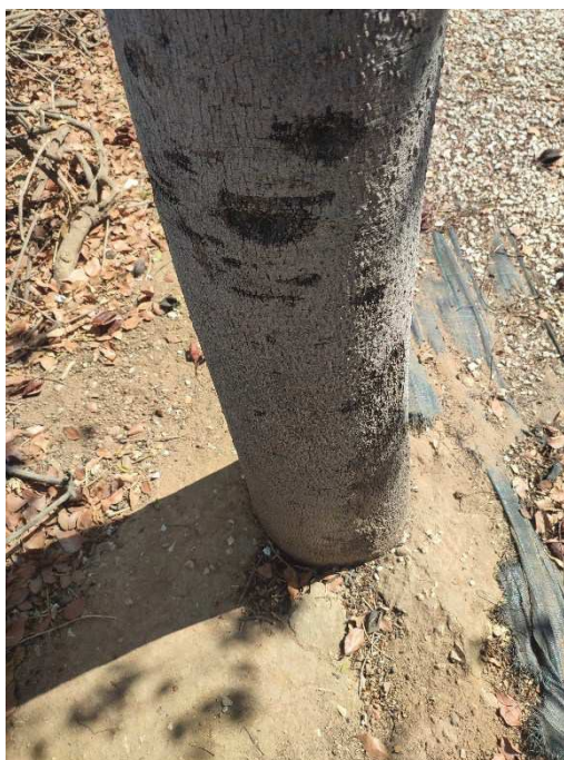
Imágenes del ejemplar con id 48