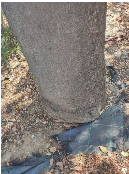
Imágenes del ejemplar con id 59