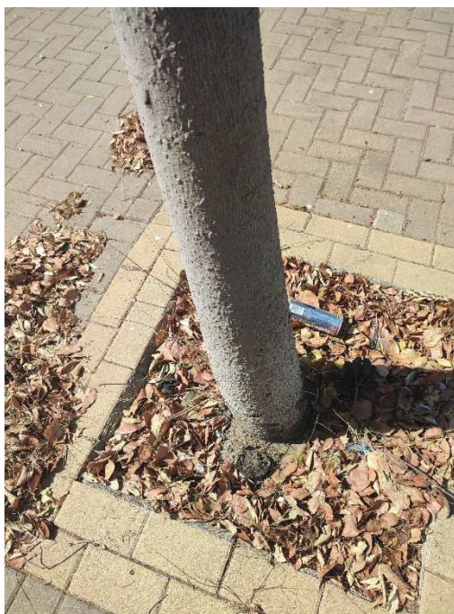
Imágenes del ejemplar con id 73