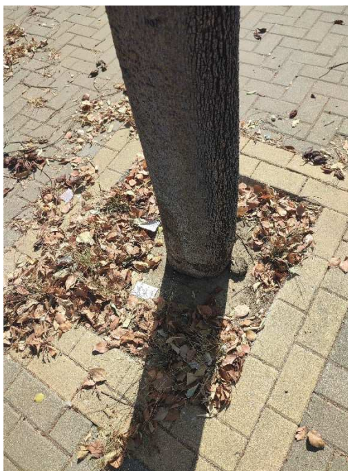
Imágenes del ejemplar con id 76