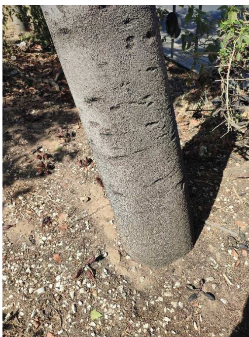
Imágenes del ejemplar con id 115