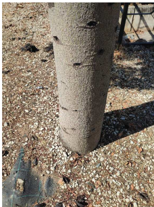
Imágenes del ejemplar con id 118