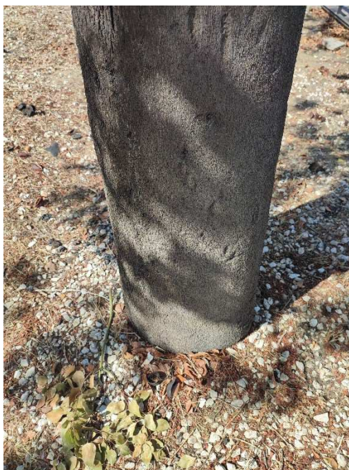
Imágenes del ejemplar con id 129