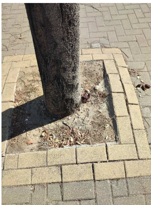
Imágenes del ejemplar con id 146