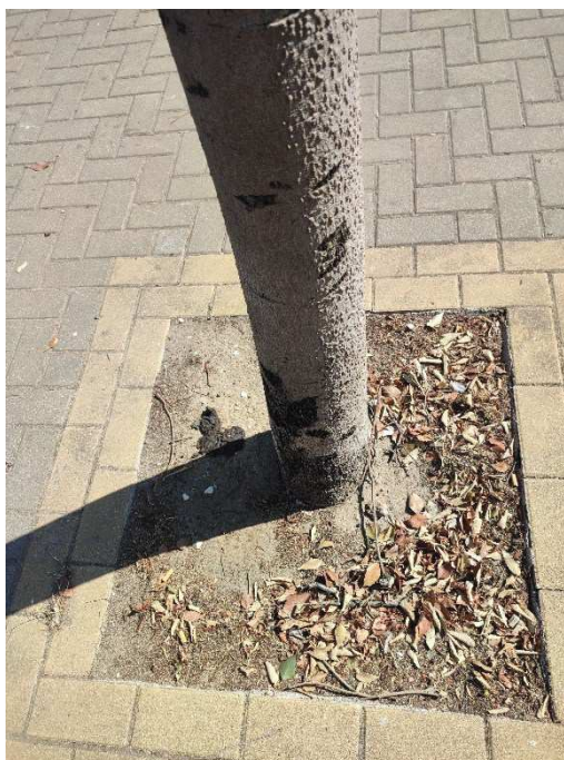
Imágenes del ejemplar con id 148