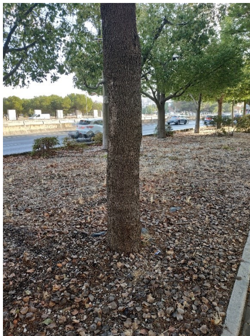
Imágenes del ejemplar con id 357