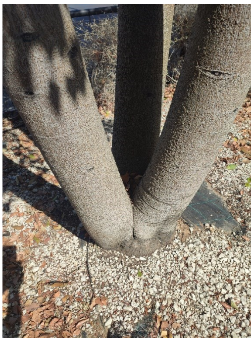
Imágenes del ejemplar con id 123204