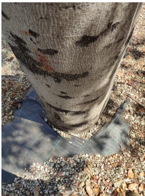
Imágenes del ejemplar con id 123214