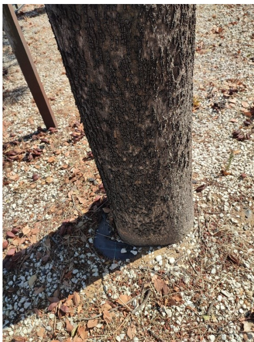
Imágenes del ejemplar con id 183