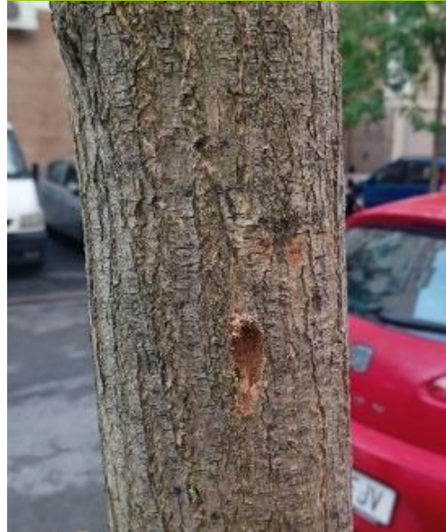
Comprobación árbol seco.

Ayuntamiento de Sevilla Plaza Nueva, 1 41001 Sevilla +34 955 010 010 www.sevilla.org