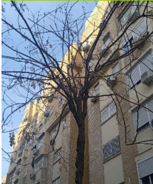
Defoliación y ramas secas superior al 90% de la copa