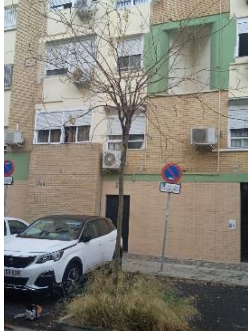
Vista general: árbol seco.