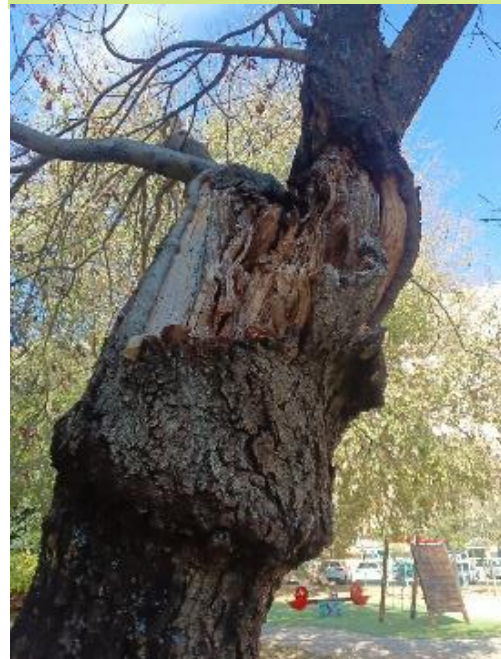
Defoliación y ramas secas superior al 90% de la copa, descortezamiento con fendas verticales y gomosis/exudaciones

Ayuntamiento de Sevilla Plaza Nueva, 1 41001 Sevilla +34 955 010 010 www.sevilla.org