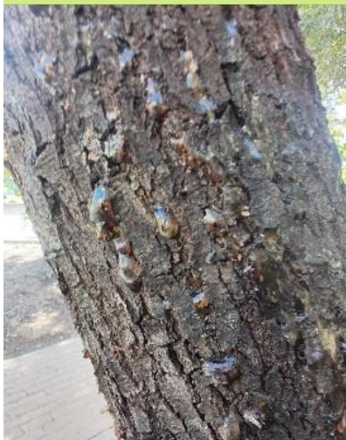
Presentaba en tronco cavidad en la base a partir de daños mecánicos, engrosamientos a mediación y gomosis generalizada.