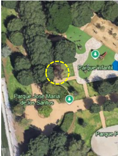
Localización: Prunus cerasifera pisardii con ID 40920 en el Parque José María de los Santos