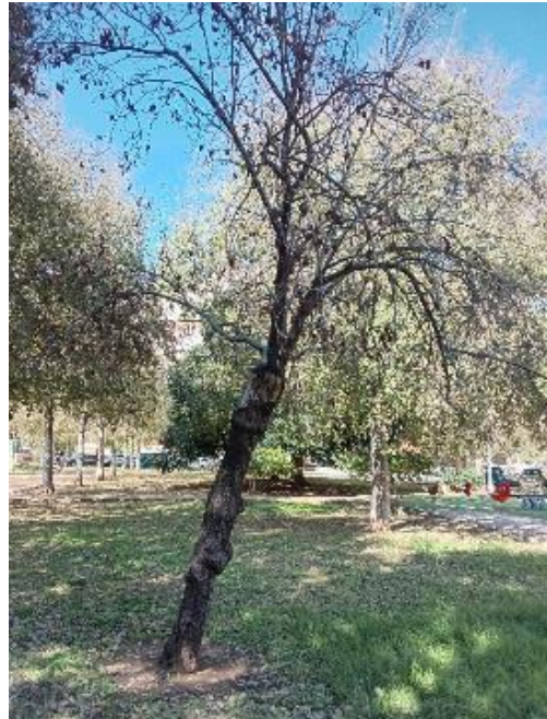
Vista general: árbol seco e inclinado.