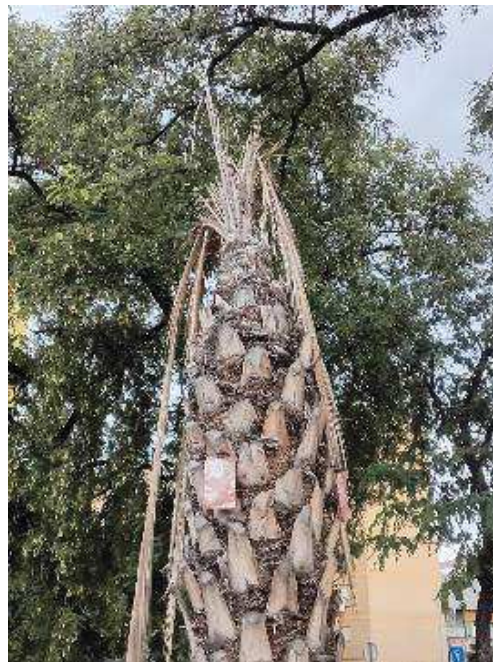
Palmas y meristemo apical seco.

Ayuntamiento de Sevilla Plaza Nueva, 1 41001 Sevilla +34 955 010 010 www.sevilla.org