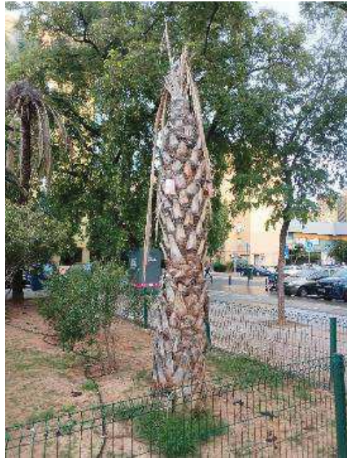
Vista general: palmera seca.