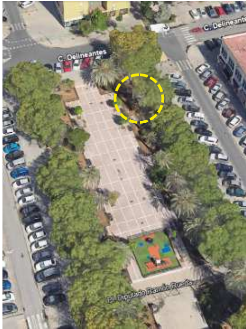
Localización: Phoenix dactylifera con ID 44149 en la Plaza Diputado Ramón Rueda del Distrito Norte.