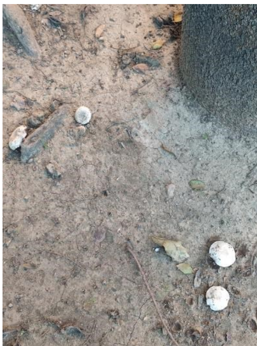
Imágenes del ejemplar con id 27