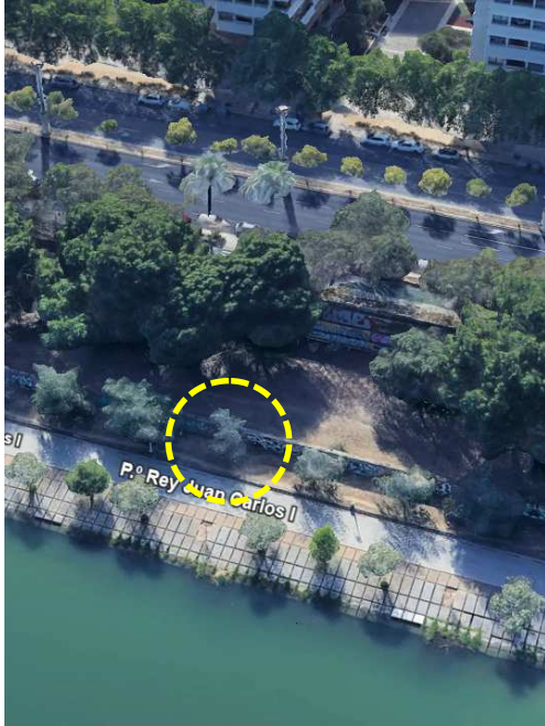
Localización: Populus alba con ID 116 en el Paseo Juan Carlos I del distrito Macarena