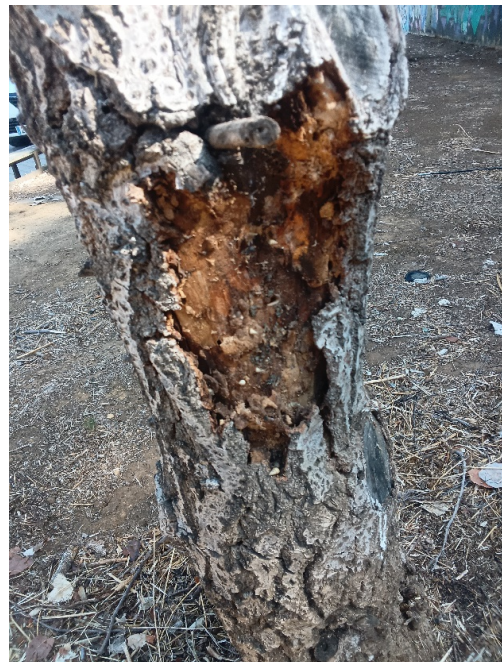
Prácticamente sin copa: defoliación y ramas secas superior al 90% de la copa. Heridas por asolanamiento en tronco, ataque de insectos perforadores taladros y cancro generalizado en tronco y resto de la estructura.

Ayuntamiento de Sevilla Plaza Nueva, 1 41001 Sevilla +34 955 010 010 www.sevilla.org