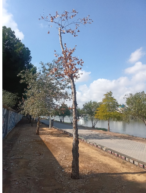
Vista general: árbol seco.