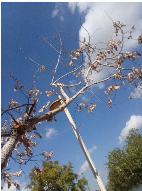
Árbol prácticamente sin copa: defoliación y ramas secas superior al 90%. Heridas por asolanamiento, ataque de insectos perforadores y cancro generalizado en tronco y resto de la estructura