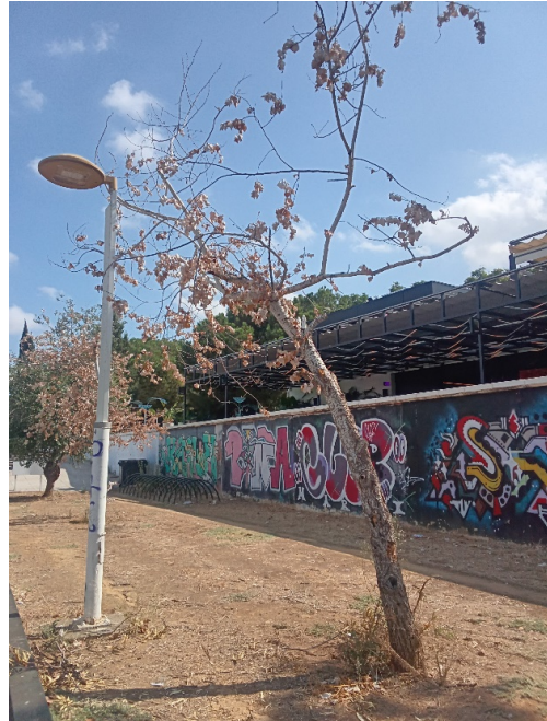
Vista general: árbol seco.