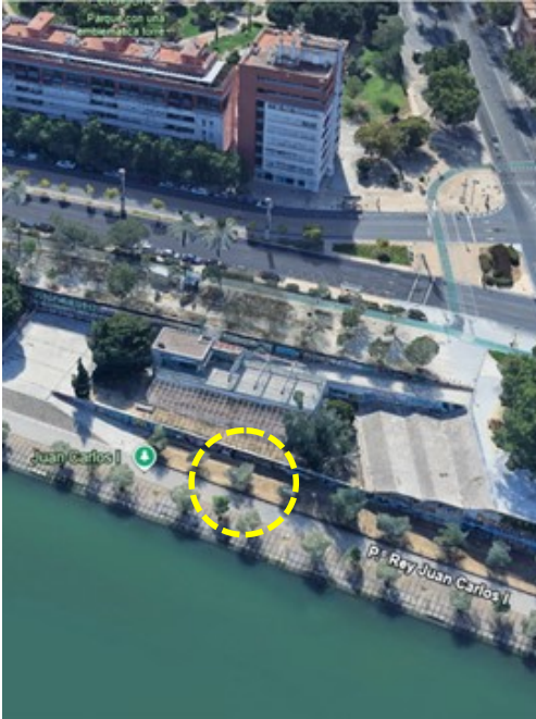
Localización: Populus alba con ID 194 en el Paseo Juan Carlos I del distrito Macarena