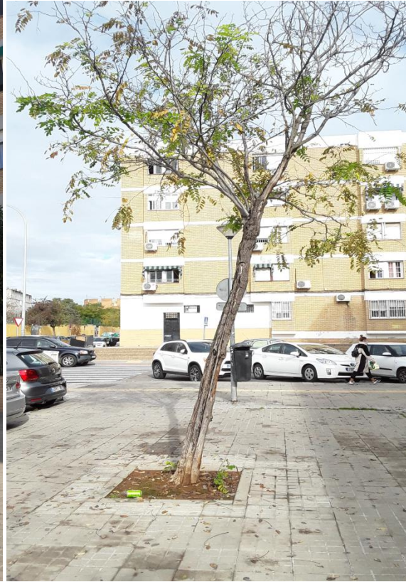
Inspección realizada el 17/10/2020

Calle Nicolás Alpérez s/n (Pabellón de la Telefónica de la Exposición de 1929) 41013 Sevilla Teléfono 95 54 73232