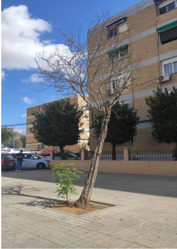
Foto anterior a su apeo