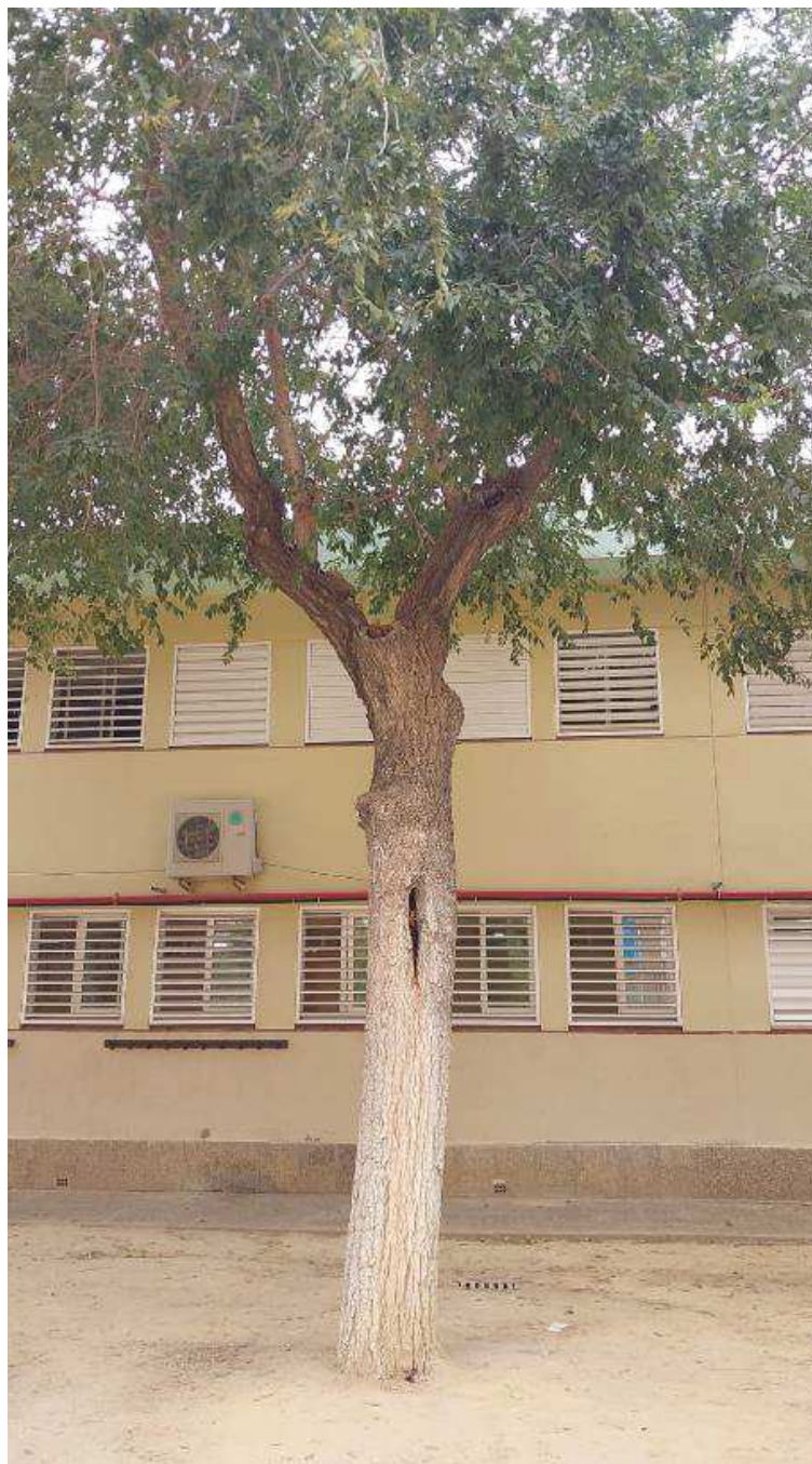
Calle Nicolás Alpérez s/n (Pabellón de la Telefónica de la Exposición de 1929) 41013 Sevilla Teléfono 95 54 73232