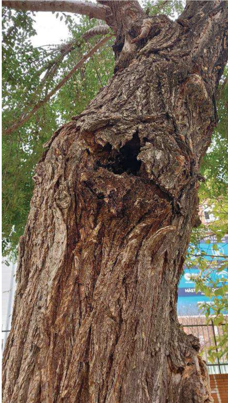
Calle Nicolás Alpérez s/n (Pabellón de la Telefónica de la Exposición de 1929) 41013 Sevilla Teléfono 95 54 73232