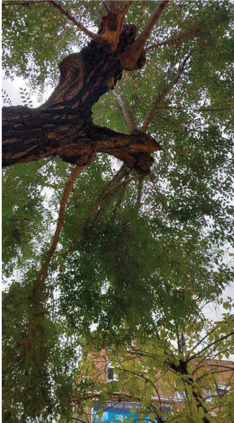
Calle Nicolás Alpérez s/n (Pabellón de la Telefónica de la Exposición de 1929) 41013 Sevilla Teléfono 95 54 73232