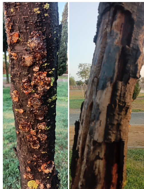
Defoliación y ramas secas superior al 90% de la copa. Gommosis generalizada y conjunto de heridas graves en el cuello/base del tronco producida por daños mecánicos y por asolanamiento en el resto del tronco.

Ayuntamiento de Sevilla Plaza Nueva, 1 41001 Sevilla +34 955 010 010 www.sevilla.org