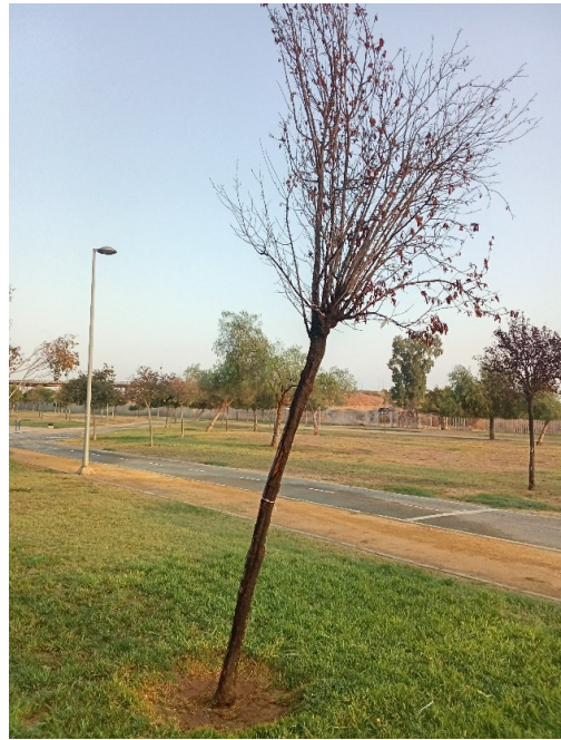
Vista general: árbol seco.