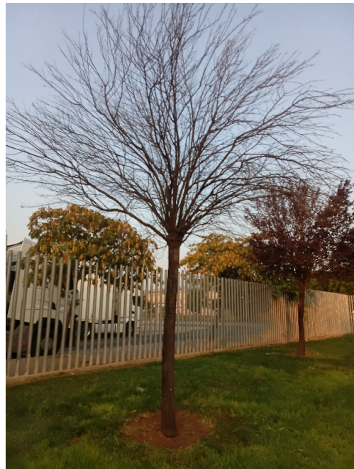
Vista general: árbol seco.