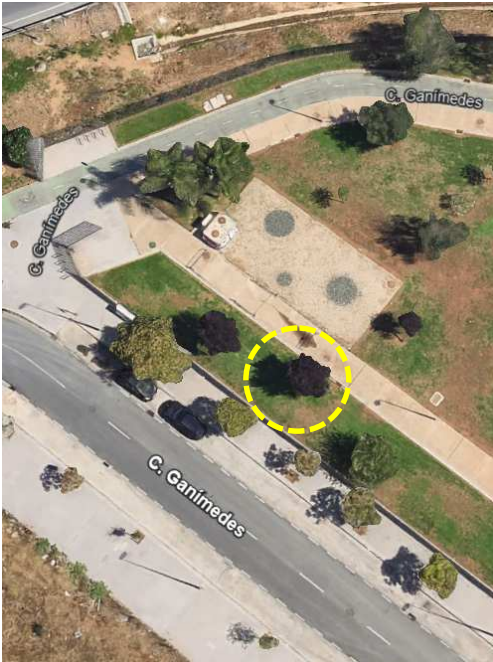
Localización: Prunus cerasifera pisardii con ID 125396 en la Parque Ciudad de la Imagen del distrito Norte