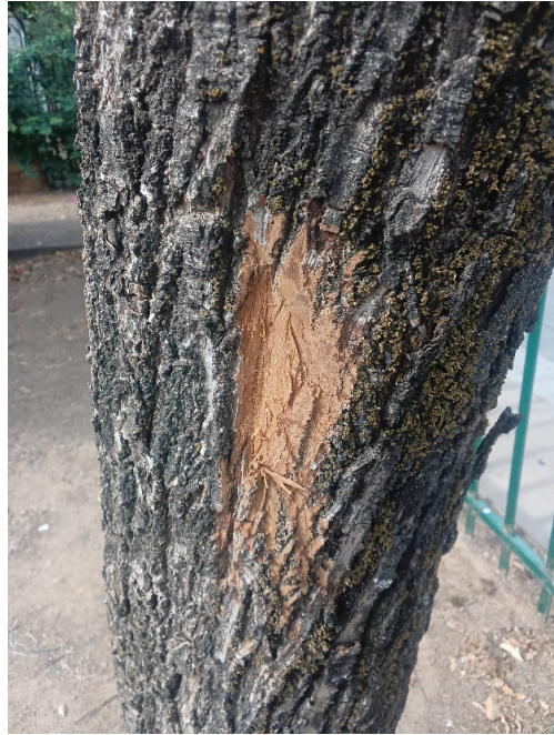
Comprobación árbol seco.

Ayuntamiento de Sevilla Plaza Nueva, 1 41001 Sevilla +34 955 010 010 www.sevilla.org