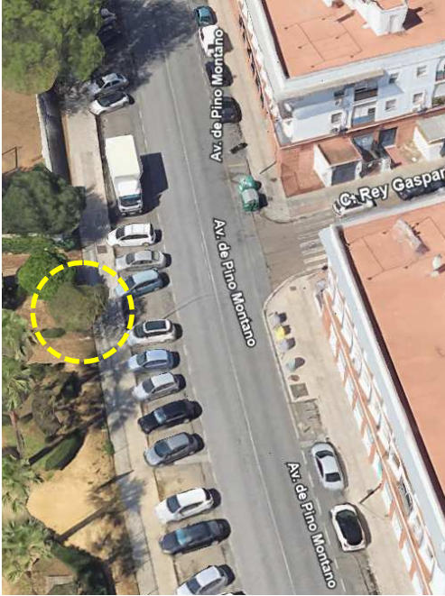
Localización: Ligustrum lucidum con ID 40851 en el Parque Jardines de San Diego, del distrito Norte