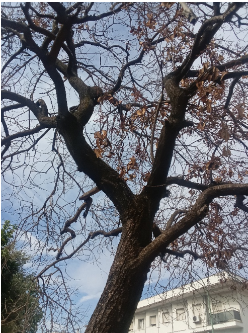
Defoliación y ramas secas superior al 90% de la copa