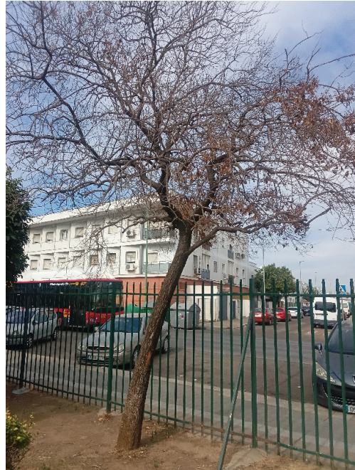
Vista general: árbol seco.