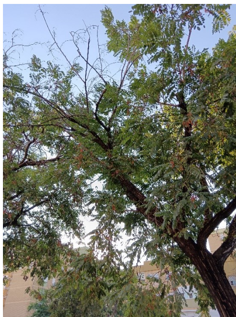
Pequeñas lesiones en tronco y copa