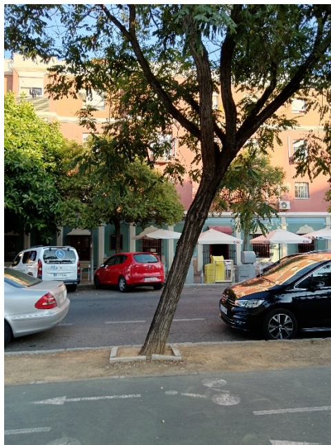
Vista general del ejemplar con id 43985 e inclinación de tronco