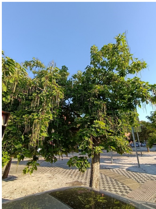
Vista general del ejemplar con id 43885