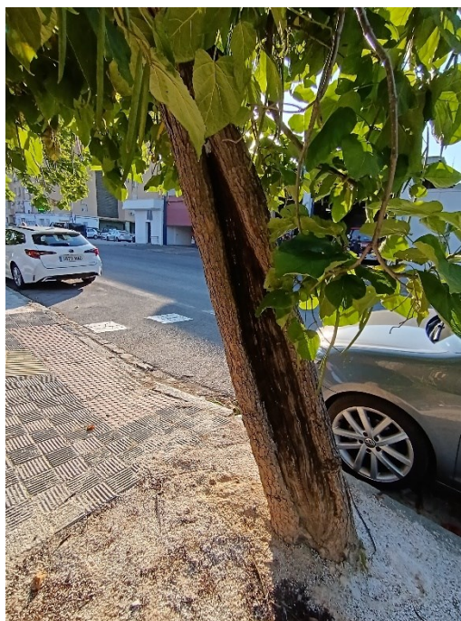
Detalle de lesiones en tronco