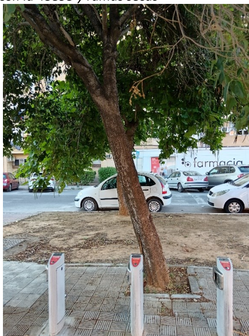
Detalle de lesiones en tronco