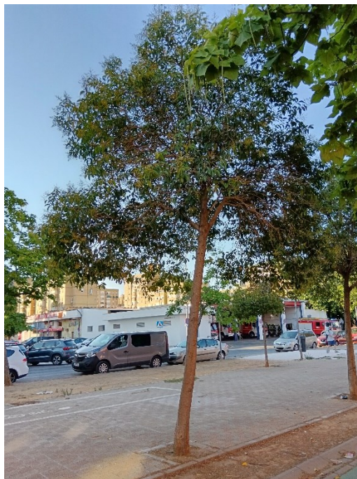
Vista general del ejemplar con id 43924