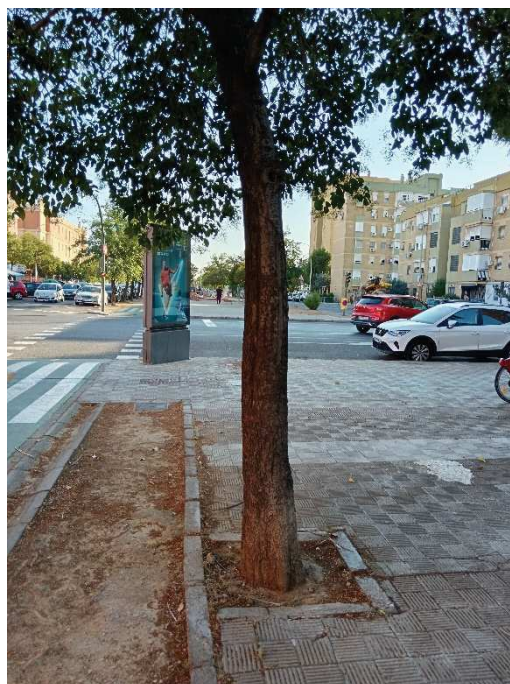
Detalle de lesiones en tronco