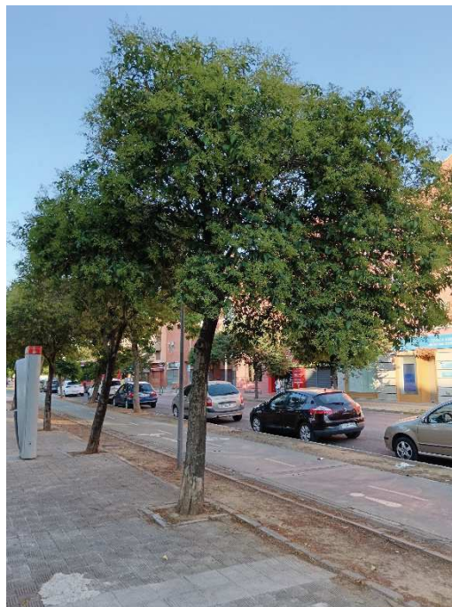
Vista general del ejemplar con id 43927