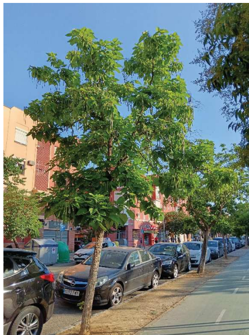
Vista general del ejemplar con id 43934