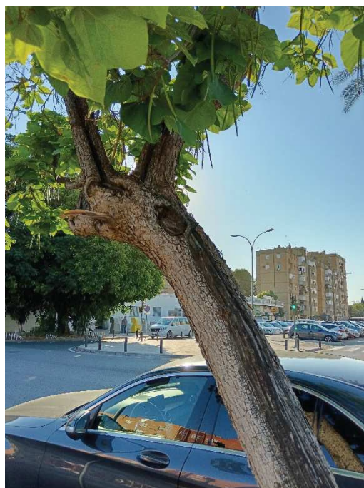
Detalle de lesiones en tronco